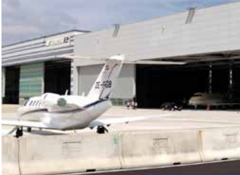
Flughafen Wien – Hangar 7